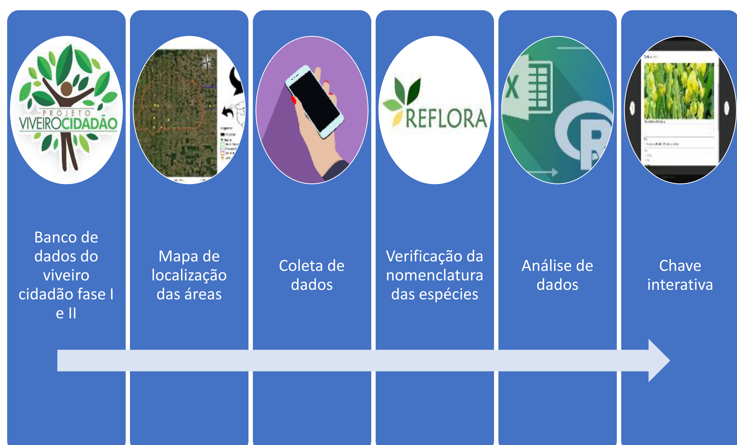
FIGURA 02. Processo metodológico.