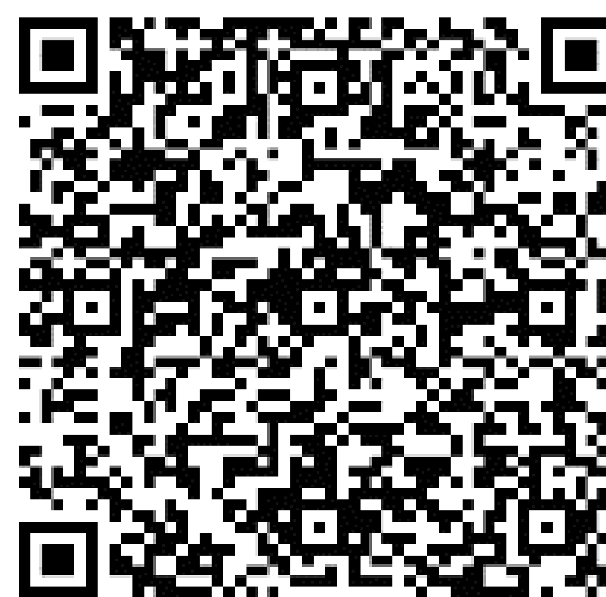
FIGURA 04. Qr code da chave interativa.

A chave desenvolvida pode ser acessada no qr code (figura 04) ou no link: < http://www.xper3.com/xper3GeneratedFiles/publish/identification/3143261099812012911/mkey.html >.